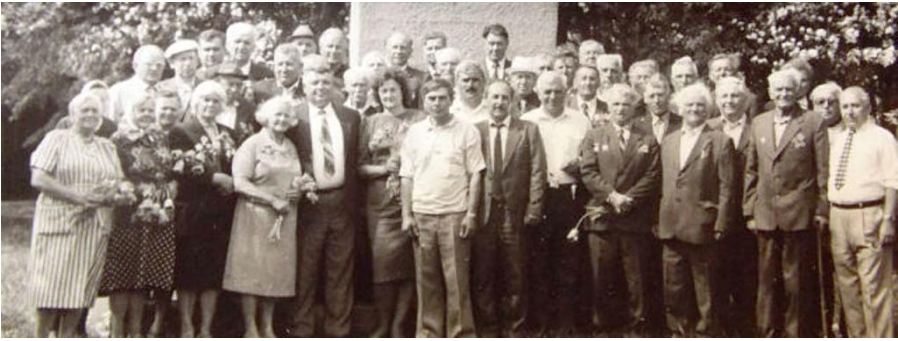
Ветэраны Вялікай Айчыннай вайны з кіраўніцтвам завода

У 1968 годзе заводу перададзены на правах філіяла вытворчы ўчастак у г. п. Давыд-Гарадок Столінскага раёна Брэсцкай вобласці. Прадпрыемства было ператворана ў Кобрынскае інструментальнае вытворчае аб'яднанне. З кожным годам завод асвойваў усё новыя і новыя віды вырабаў, нарошчваючы аб'ёмы вытворчасці, і да 1971 года больш як удвая перакрыў свае практныя магутнасці.